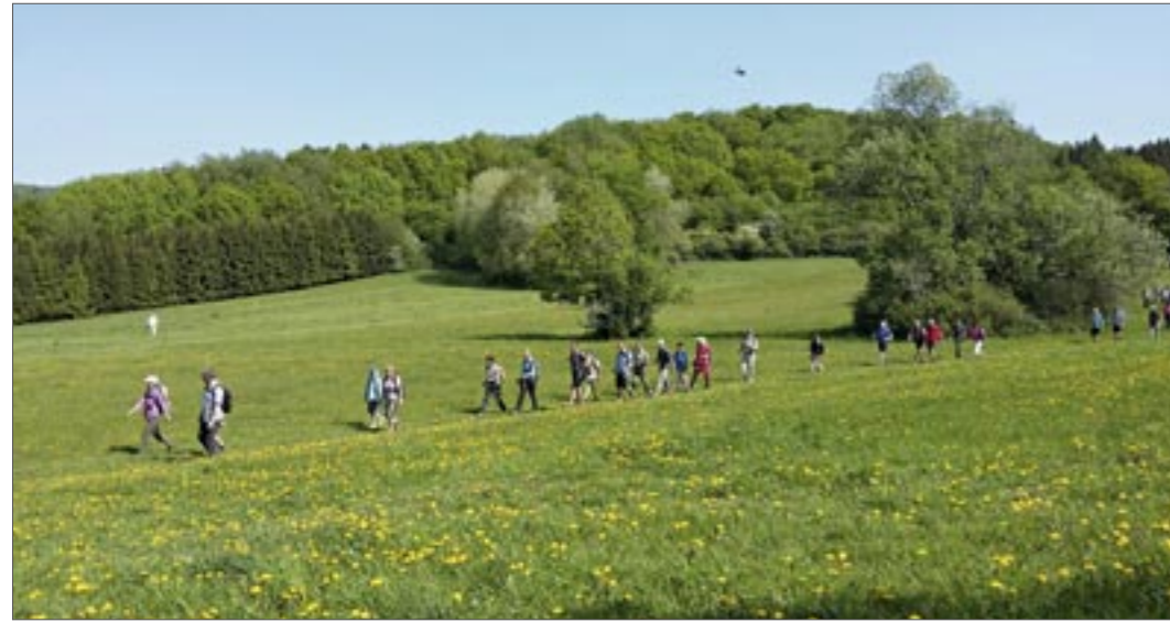
Unterwegs auf „Schusters Rappen“