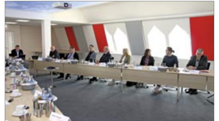
Vertreter der Kreissparkasse St. Wendel, der SG-Strukturholding, des Steyler Missionare des Architekturbüros Giarizzo, von Kern Plan und von der Stadt St. Wendel präsentierten das neue Nutzungskonzept für das Missionshaus unter dem Motto „Green Living“.

„Zusätzlich wird die SG Strukturholding GmbH am 20. April um 10 Uhr in der Aula des Missionshauses die bisherigen Planungen der interessierten Öffentlichkeit vorstellen.“