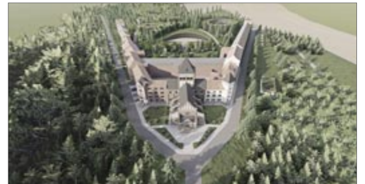
So könnte es einmal aussehen: die historische Bausubstanz soll erhalten werden und in das neue Nutzungskonzept harmonisch integriert werden.