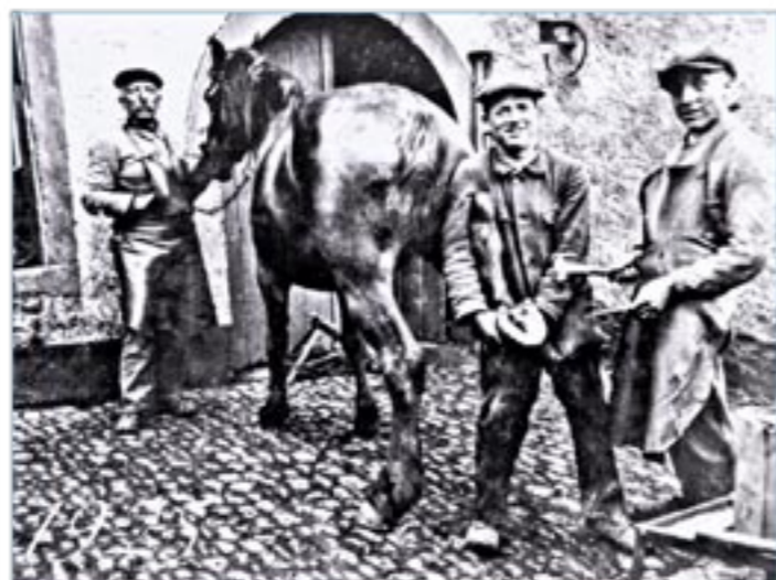
Ein Foto aus dem Jahr 1925: Aus einer kleinen Schlosserei mit Hufschmiedarbeiten hat sich bis heute ein moderner Handwerksbetrieb entwickelt.