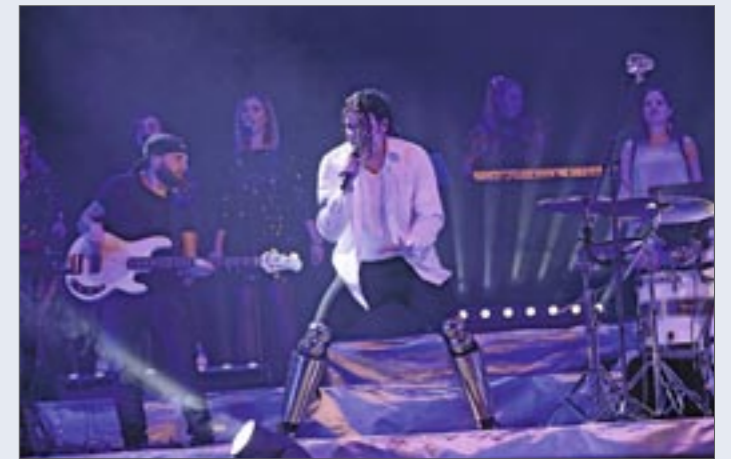
Michael Jackson Tribute