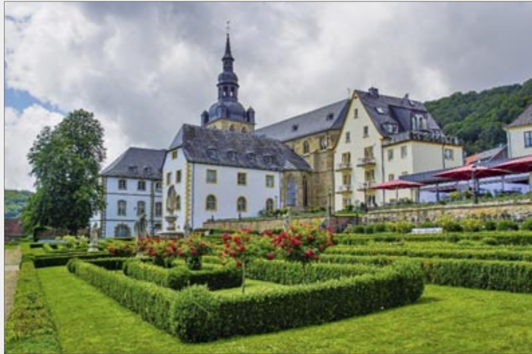
Blick auf die Abteikirche in Tholey